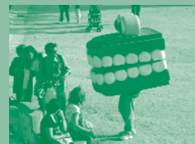
La Queta, un dels convidats d'honor de la Tamborinada.

Com cada any l'Agrupació de Colles de Geganters de Catalunya ha posat color a la festa amb els seus gegants i la Generalitat de Catalunya ha ofert la seva ludoteca al públic. D'altra banda, La Residual ha presentat el seu espectacular cercavila amb personatges gegants fets amb material reciclat.