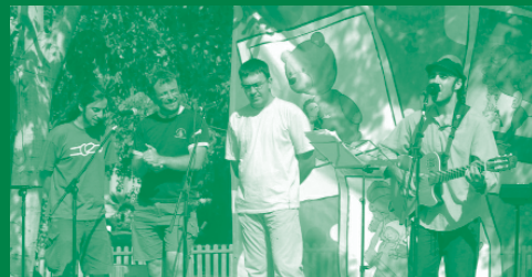
La colla de l'AMAPEI, l'Associació de Músics i Animadors Professionals d'Espectacles Infantils, va presentar un disc a favor dels drets dels infants