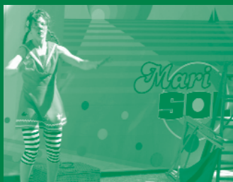
Cirquet Confetti amb el seu nou espectacle, Marisol.