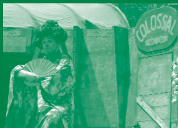
Teatre Mòbil i el seu divertidíssim Colossal van obtenir un gran èxit.