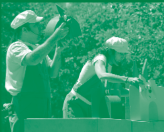
Xip Xap va presentar Els músics de Bremen.

Una menció especial per al grup Cop de Clown i les seves magnífiques inauguració i cloenda, que van fer participar tothom en una gran festa d'humor i de participació. Durant tot el dia, el parc va ser l'escenari privilegiat per veure excel·lents espectacles, una mostra dels que la Fundació La Roda programa arreu de Catalunya durant tot l'any.