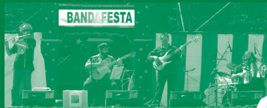
Al migdia Bandafesta va fer esclatar el seu talent per al públic de la Tamborinada.