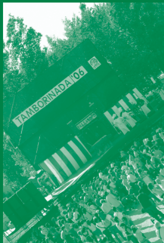
Cop de Clown i els seus genials pallasos van animar la inauguració i la cloenda.